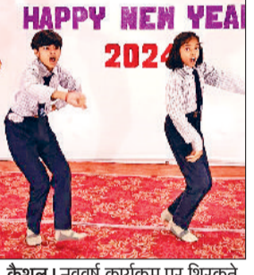
नववर्ष कार्यक्रम पर थिरकते एमडीएन ग्लोबल स्कूल के विद्यार्थी।