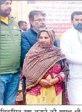
विकसित राष्ट्र बनाने की शपथ भी दिलाई। उन्होंने कहा कि इस यात्रा में गरीब लोग अपने घर द्वार पर ही योजनाओं का लाभ ले रहे हैं। सभी

विभाग अपनी-अपनी योजनाओं की पूर्ण जानकारी ग्रामीणों को मौके पर दे रहे हैं। पात्र व्यक्तियों को सीधा लाभ कार्यक्रम में दिया जा रहा है।