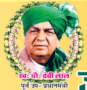
श. वी. देवी लाल पूर्व उष-प्रधानमंत्री