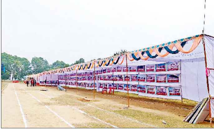
उच्चा। बांगर उत्सव को लेकर लाए जा रहे प्रदर्शनी स्टॉल।